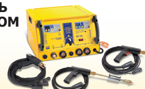
SPEEDLINER Combi 230 E PRO - Арт. 035072