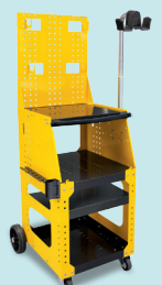
Тележка Spot 1600 Арт. 051348