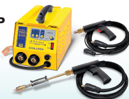
SPEEDLINER PRO 230 - Арт. 035034 SPEEDLINER PRO 400 - Арт. 035041