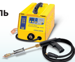
SPEEDLINER 39.02 - Арт. 035010 SPEEDLINER 39.04 - Арт. 035027