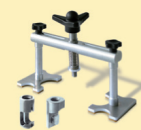
Alu Puller Арт. 051003