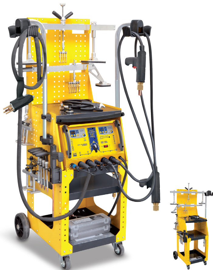
Без генератора Арт. 035058