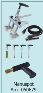
Manuspot Арт. 050679